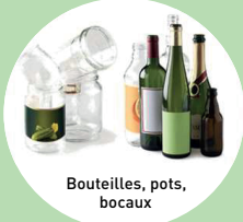
Bouteilles, pots, bocaux

SANS BOUCHONS BIEN VIDER INUTILE DE LAVER